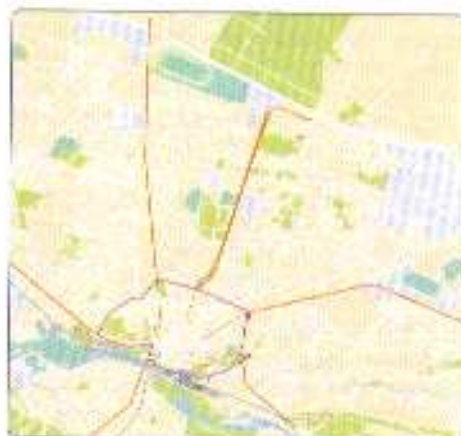
— axes pénétrants — boucle de contournement du centre-ville

Pau se caractérise par l'existence de 5 axes pénétrants qui convergent vers le centre-ville : rue du XIV juillet au Sud, route de Bayonne à l'Ouest, route de Bordeaux au Nord, route de Morlaàs au Nord-Est et route de Tarbes à l'Est.